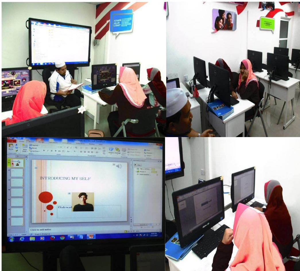
Pelajar diajar menggunakan aplikasi Microsoft powerpoint sepertimana mengikut modul yang ditetapkan dalam Intel Easy Step.

Kelas : Intel Easy Step Tarikh : 17/02/2017 Masa : 9.00am-1.00pm, 2.00pm-6.00pm Tempat : Pusat Internet 1malaysia Pekan Jelawat